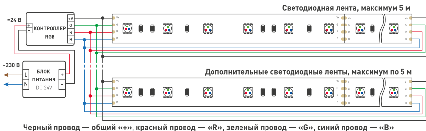
Схема 2. Подключение нескольких светодиодных лент с двух сторон Рекомендуется использовать для обеспечения равномерного свечения ленты по всей длине.